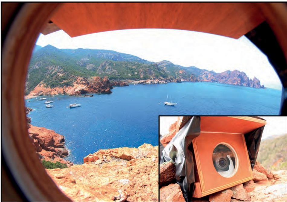
Vista della baia di Elbu con il sistema DPDA. In basso a destra: la telecamera nella sua custodia protettiva.

I risultati principali mostrano un'alta densità nella baia di Elbu, situata per lo più nella sabbia vicina alla riva (barche semirigide), e nella prateria di posidonia (barche a vela). Questa zona è soggetta ad una pressione elevata, ma molto limitata nel tempo (solo in luglio e agosto, fino a 40 ancoraggi/ha/g; Immagine a pagina 89). Lo stato e la vitalità della prateria di posidonia sono stati misurati usando due indicatori (EBQI 'Ecosystem-based Quality Index' e MCAI 'Multi-Criteria Anchoring Index'; Rouanet et al. 2013; Personnic et al. 2014); non si evidenzia chiaramente un degrado della prateria rispetto alle stazioni di controllo.