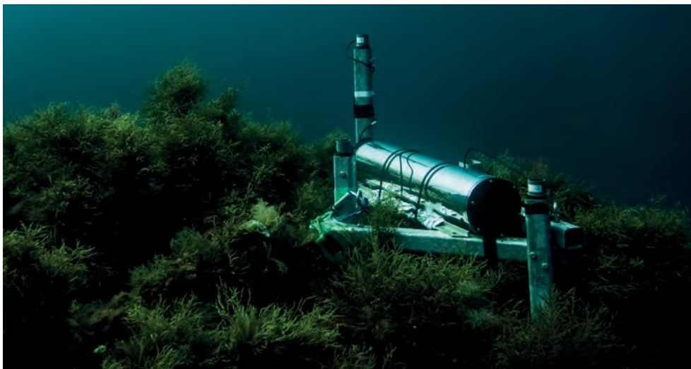
Idrofoni posizionati sulla roccia degli Organi

Anche se questi risultati possono essere spiegati da variazioni biologiche stagionali, o dalla pressione della pesca localizzata in alcuni siti, non si può escludere l'ipotesi di un impatto legato al rumore del traffico nautico.