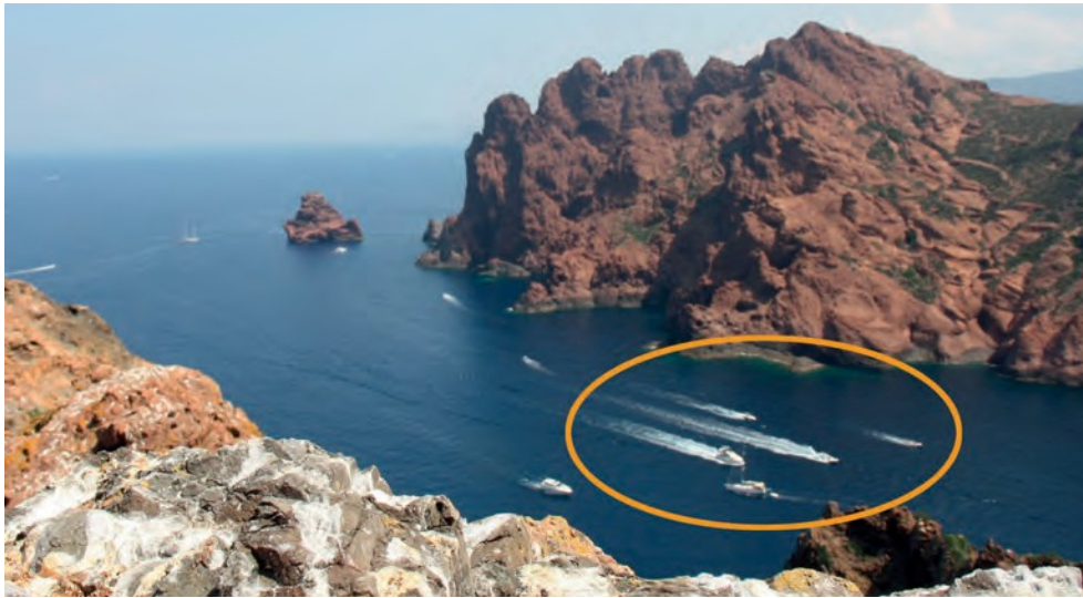
Foto scattata dall'isola di Gargalu dal sistema DPDA. Il cerchio arancione mostra le barche che navigano ad alta velocità nel Passo di Palazzu -limitato a 5 nodi- (fonte: GIS Posidonie).