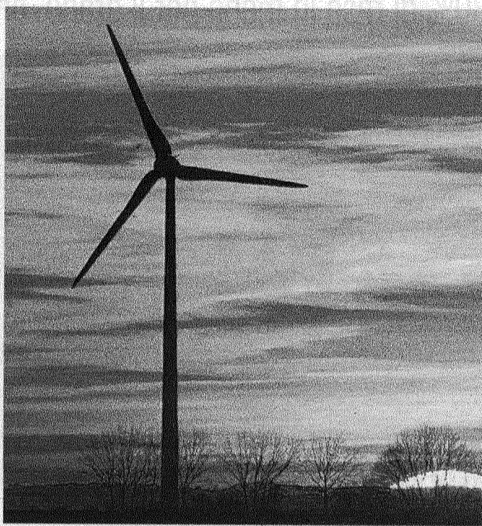
Energie rinnovabili Cna Siena ci mette grande attenzione

prie dimensioni e caratteristiche: con un percorso che si avvia con l'evento e che comprende un'attività diffusa di scouting per la rilevazione dei dati e dei fabbisogni, necessari a calibrare e strutturare, e quindi promuovere presso le imprese, il miglior servizio di informazione e consulenza ad hoc. Per partecipare all'evento o chiedere maggiori informazioni, divisione-energia@cnasiena.it