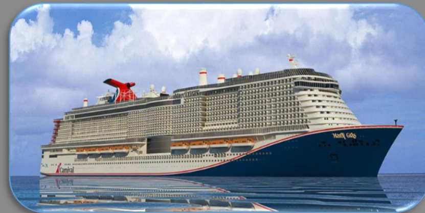
CARNIVAL MARDIS GRAS dicembre 2020