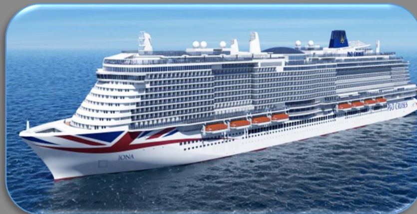
IONA ottobre 2020