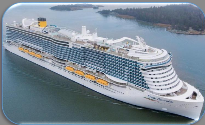
COSTA SMERALDA dicembre 2019