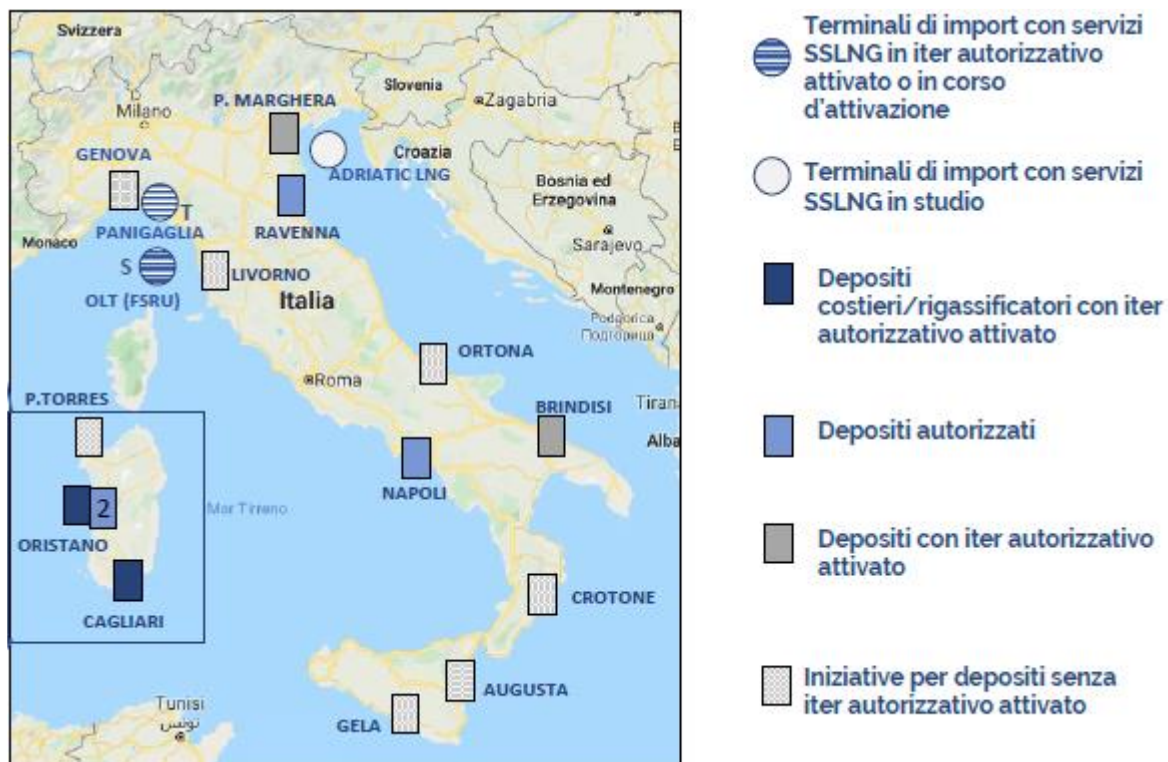
Figure A. Initiatives pour les dépôts côtiers SSLNG en Italie au 30 avril 2020.