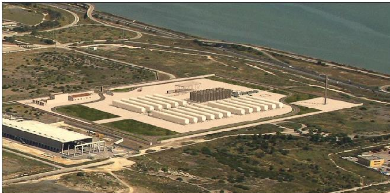
Figure A.4 Projet de depot côtier Isgas Multiutilies - Port du canal de Cagliari

En ce qui concerne le dépôt côtier de Sardaigne LNG, la procédure d'EIE est toujours en cours.