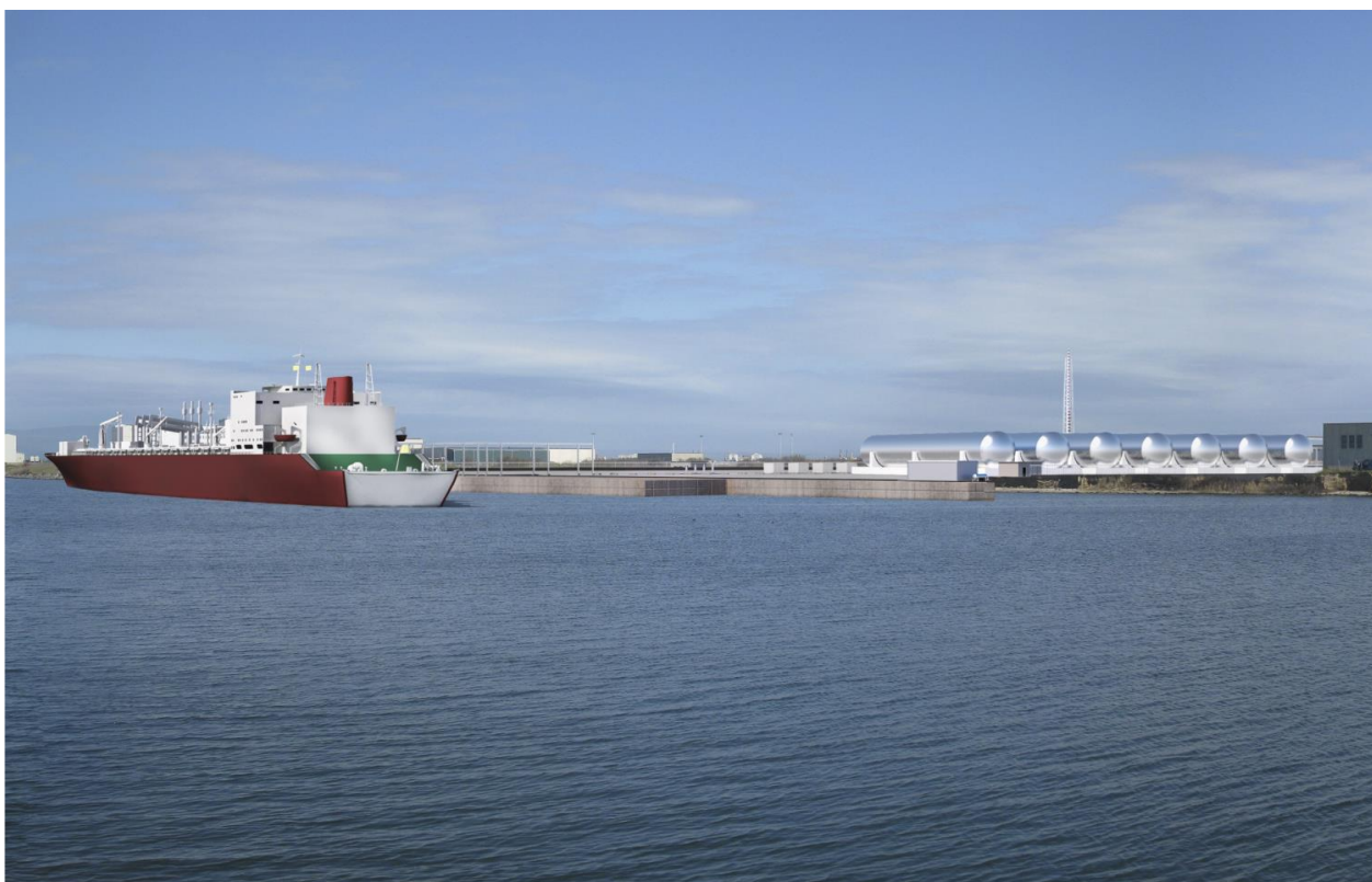
Figure A.2 Projet de depot côtier d'Edison - S. Giusta (Oristano)

Même les mesures réglementaires ultérieures de l'ARERA (voir paragraphe 3.2) n'ont pas été jugées suffisamment claires par Edison pour démarrer les travaux.