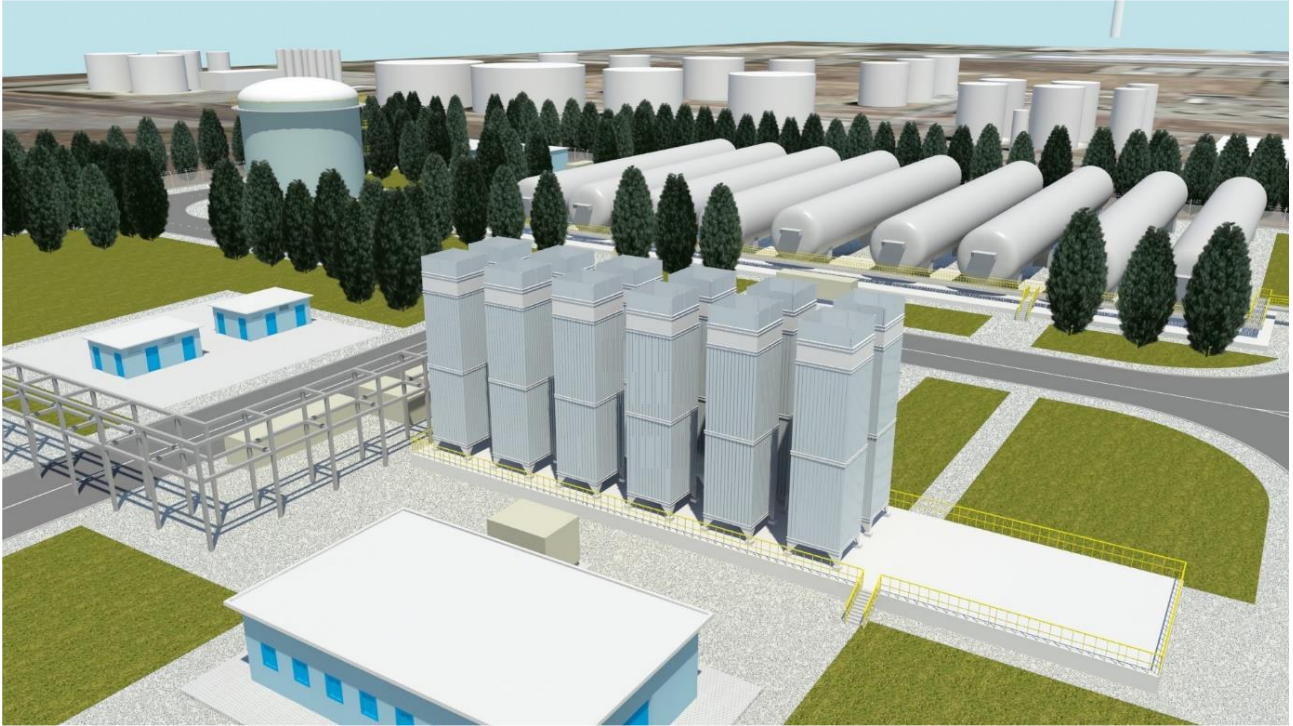
Figure A.3. Projet de dépôt côtier IVI Petrolifera - Port de S. Giusta (Oristano)