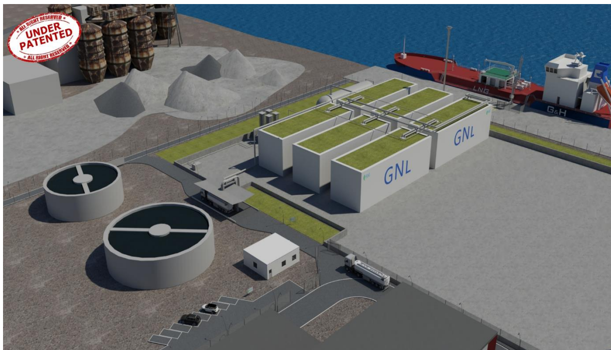
Figure A.1. Projet de depot côtier de Higas - Port de S. Giusta Oristano

Le 29 novembre 2018, les travaux ont commencé sur le chantier, où l'assemblage des six réservoirs cryogéniques a été livré et a commencé en 2019, suivi de la construction des infrastructures de service. La construction des méthaniers Avenir se poursuit, l'un déjà opérationnel et l'autre lancé récemment, destiné aux marchés asiatique et sud-américain, tandis que le troisième en construction devrait être destiné à la Méditerranée. Malgré les ralentissements causés par la crise épidémique, l'usine est en voie d'achèvement avec une livraison prévue pour la fine du 2020 et le démarrage des opérations dans l'année. Compte tenu de l'avancement des autres projets de dépôts côtiers, l'usine d'Higas sera la première du genre en Méditerranée et pourra initier l'utilisation du GNL dans les transports et les industries en plus de la méthanisation des zones environnantes. Cependant, la construction de réseaux locaux n'a pas encore commencé.