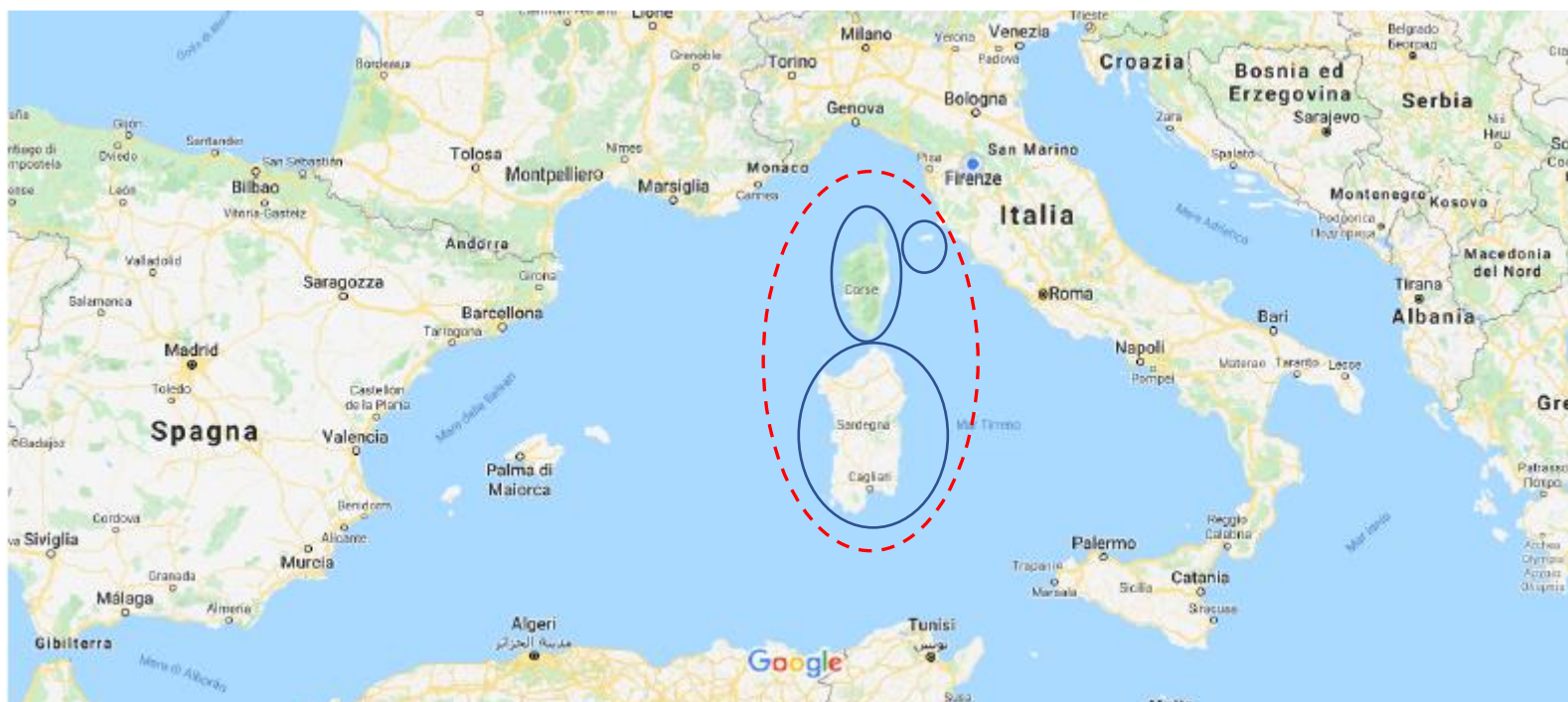
Figure 3.1 Système insulaire de la zone de coopération Italie France Maritime