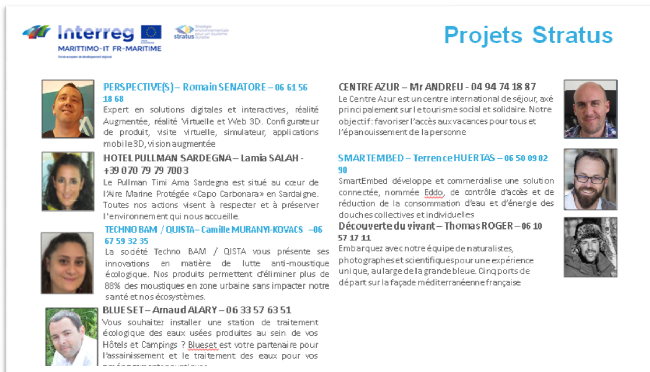
Tableau 2 : Projets présentés durant la session « pitch » Stratus