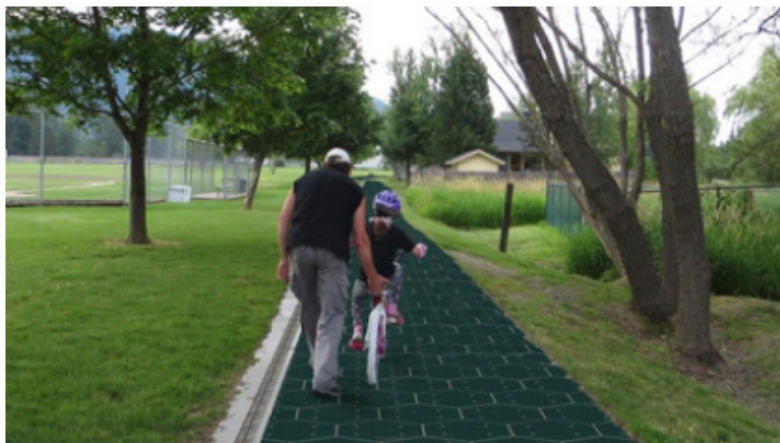
esempio di pista ciclabile solare

pista ciclo-pedonale rivestita di pannelli fotovoltaici, sormontati da una lastra di vetro antiscivolo e integrati in una struttura d'acciaio sollevata e ancorata a terra, in grado di produrre energia che andrà a soddisfare il fabbisogno di chi si trova in prossimità del tracciato. L'area perfettamente integrata con i già esistenti percorsi ciclo-pedonali diventerà un parco ricreativo per la comunità ed un luogo di scambio per la promozione della bicicletta come mezzo di locomozione in tutto il territorio.