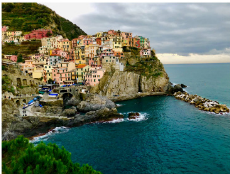
L'antico borgo di Manarola alle Cinque Terre (Liguria di Levante)

Al termine della due giornate, è presentata una conferenza stampa di chiusura dell'evento e la presentazione delle pubblicazioni redatte nell'ambito del progetto STRATUS.