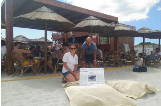
Cuscini di Posidonia a Villasimius

ENEA, in collaborazione con l'Area marina protetta di Capo Carbonara, ha lanciato un'iniziativa inerente la gestione ambientale della Posidonia in modo da valorizzare questa risorsa naturale così importante.