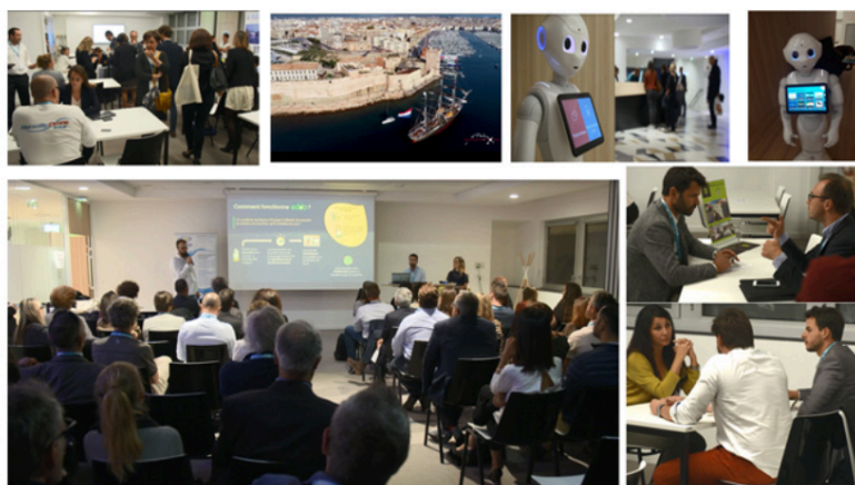
Fiera di Marsiglia

La terza fiera si è tenuta a Marsiglia il 25 ottobre 2018 nell'ambito del Tourism Business Meeting , evento a cadenza annuale organizzato dalla camera di commercio Marseille Provence, alle quale hanno partecipato imprese italiane e francesi operanti nei due settori, turistico e ambientale, per promuovere le loro soluzioni o il loro impegno a favore di un turismo eco-responsabile.