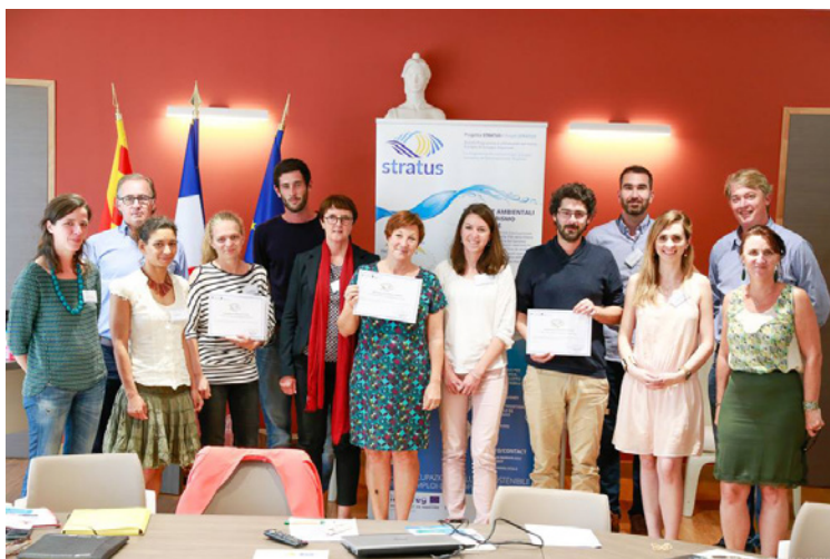
Quelques entreprises certifiées STRATUS dans le Var lors de la remise des certificats

Il marchio STRATUS è stato attribuito a fronte della conformità di tali imprese a una serie di criteri obbligatori e facoltativi, riguardanti principalmente la comunicazione sull'ambiente e la sensibilizzazione alle tematiche ambientali, la tutela della biodiversità tramite l'adozione di sistemi di gestione e azioni legate alla salvaguardia del patrimonio naturale, una più attenta gestione delle risorse idriche, energetiche e dei rifiuti, il sostegno allo sviluppo dell'economia locale e la responsabilità sociale verso le categorie più deboli.