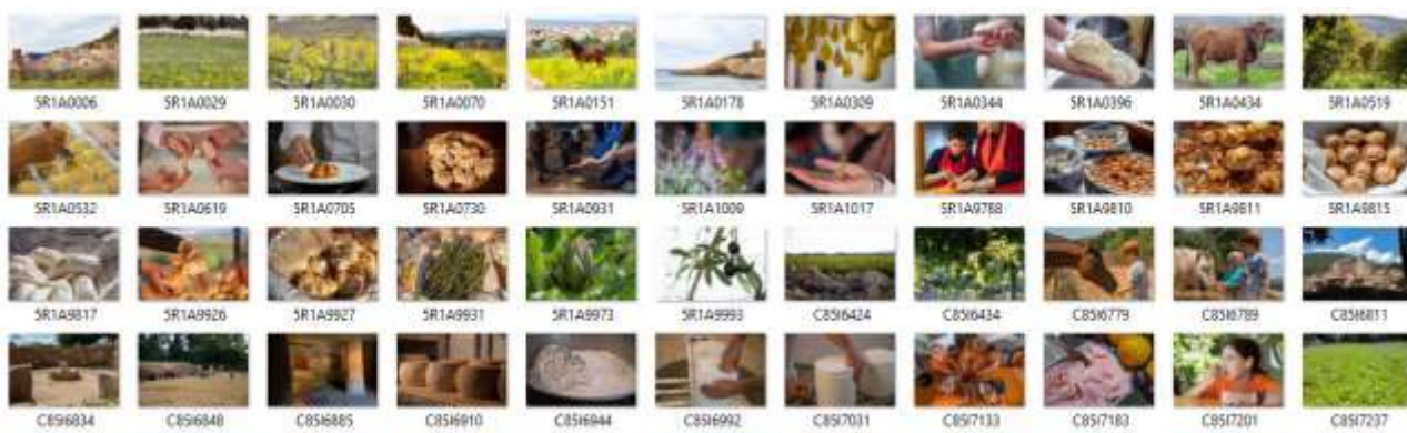
FOTO CATALOGO DIGITALE